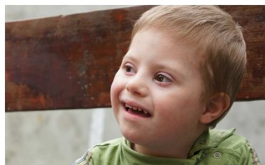
De jongste bij Ciora: Wat een mooi kereltje. Maar zijn toekomst...?

B ij de familie Ciora is het moeilijk. De jongste van de 13 kinderen heeft het Syndroom van Down. Dat geeft veel zorg en extra kosten. De oudste twee kinderen zijn vanwege de altijd maar aanwezige geldzorgen en de spanning die dat met zich mee brengt, vertrokken. De moeder komt er al jaren niet meer aan toe om naar de kerk te gaan. De vader werkt keihard. Hij heeft een nachtbaan en verdient ook overdag bij. Maar 11 monden vullen in de leeftijd tussen 5 en 19 jaar?