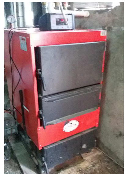
De nieuwe ketel net na de installatie

De Heer had alles in de Hand: Hij zag de situatie, heeft op het juiste moment een familie van Manna uit Nederland naar ons toe gestuurd, samen met broeder Piscoi. Ze constateerden het probleem dat ik als moeder elke dag bij de Heer bracht. Ik kon geen enkele oplossing bedenken. Wij als ouders hebben ongeveer 100 Euro per maand