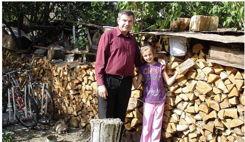
Trots en dankbaar wordt de door Manna betaalde houtvoorraad getoond. In een aantal gezinnen wordt gekookt op een houtfornuis en radiatoren worden gevoed vanuit een houtgestookte warmtewisselaar.

V eel moeders en kinderen in Roemenië staan niet snel met een mond vol tanden. Niet omdat ze hun woordje niet klaar hebben, maar vooral omdat ze vaak een slecht gebit hebben. Vitaminegebrek en geen geld voor de tandarts zijn oorzaken daarvan. Ook hier kon Manna haar steentje bijdragen. Dit komt mede door een grote gift die we dit jaar van een kerkelijke organisatie mochten ontvangen. Ook Roemeense kinderen staan niet te trappelen om naar de tandarts te gaan. Maar als je na een paar behandelingen verlost bent van de eeuwige kiespijn, dan is het tandartsleed gauw vergeten. Net zoals bij alle moeders gaan ook bij de Roemeense moeders de kinderen