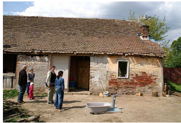
niet zo erg goed geïsoleerd