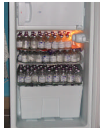
De koelkast staat vol met medicijnen...

Eind vorig jaar konden we de familie G een extra koelkast geven. Ze konden namelijk de medicijnen die hun zoon nodig heeft (een te laat behandelde hemofilie) niet kwijt. De medicijnen moeten echter wel gekoeld worden bewaard.