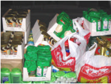
Spullen voor de paaspakketten...

P asen ligt al weer achter ons. Maar in Oost Europa is het pas op 27 april Pasen. Graag willen we onze gezinnen dan weer verrassen met een Paaspakket. De inhoud zal zoals altijd bestaan uit nuttige zaken, maar ook de lekkere dingen zullen niet vergeten worden. Doet u weer mee?