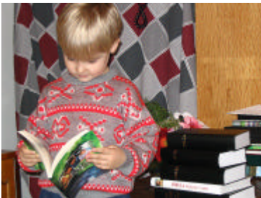
Jong geleerd... 'Man en Vader' werd bestudeerd!