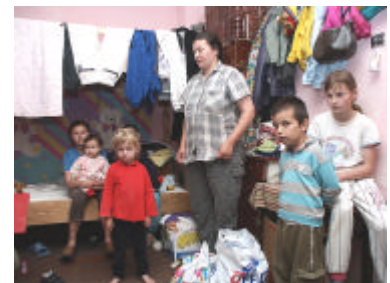
Bij de familie Sandu is het klein, héél klein, te klein!