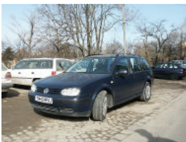
De auto die met hulp van EO-Metterdaad kon worden aangeschaft en waardoor het werk door kan gaan!

S tichting Roemenië Manna is een 'doorgeefluik'. Van de giften die binnenkomen gaat 100% naar de gezinnen die we helpen. De stichtingskosten bestaan slechts uit de reiskosten die we maken en een klein bedrag aan administratieve zaken. Afgelopen jaar moesten we echter zelf om hulp vragen. Het was een zegen te ervaren dat EO-Metterdaad samen met u de stichting te hulp kwam: de auto die zo hard nodig was in Roemenië, kon worden gekocht! Deze hulpverlening heeft ons enthousiasme versterkt voor het werk wat we samen met u iedere maand in de gezinnen mogen doen. We geven hen maandelijks ook zo'n hulpverlening. En we hopen dat we ook komend jaar maandelijks deze ervaring weer kunnen geven aan 'onze' gezinnen.