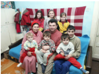
De familie Sandu 2 jaar geleden. Er is inmiddels nog een kind bij gekomen.