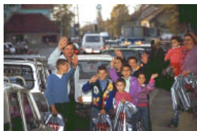
Zo maar een foto na het kopen van schoenen voor een heel gezin.

Zo is elk gezin, elk gezinslid een verhaal apart. We hebben het al eens eerder gezegd: wat zouden we u als gever en/of bidder graag eens meenemen. Om met eigen ogen te zien wat wij zien. En om u de kans te geven zelf de zegen en de blijdschap te ervaren die onlosmakelijk met geven en ontvangen van hulp verbonden is. Dat is praktisch een beetje moeilijk. Wel kunnen we u proberen te vertellen wat we meemaken en de berichten doorgeven die we krijgen van de Familie Piscoi. Zij zien maandelijks bij het rondbrengen van de sponsoring de reacties van 'onze' gezinnen. Reacties die spreken van hoop, bemoediging en zorg om de ander. Die dank willen we langs deze weg overbrengen. Telkens opnieuw wordt ons verzekerd dat er voor u, die op welke manier dan ook geeft, gebeden wordt.