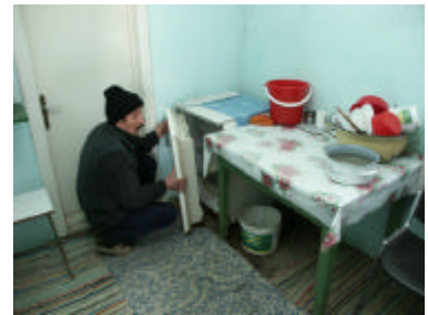
De deur viel van de koelkast. Met een steuntje bleef hij wel dicht hoor...

dankbaarheid. Als je namelijk maar zo'n €150 per maand verdient, ligt een koelkast van €242 ver buiten je bereik.