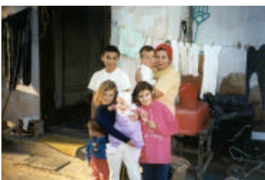
Eén van de drie nieuwe gezinnen.

I n het afgelopen jaar zijn er drie nieuwe gezinnen bijgekomen die we sponsoren. Het totaal aantal gezinnen dat we sponsoren komt daarmee op 23.