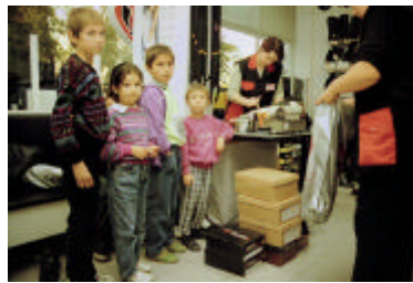
Schoenen kopen met één van de gezinnen. Dat vergeet je nooit meer!

Z o was er begin dit jaar het schoenenproject. Voor alle leden in alle gezinnen nieuwe schoenen! Wat een feest was het, ook voor ons, om met een aantal gezinnen schoenen te gaan kopen. De blije, soms ontroerde gezichten van de ouders, de verukte gezichten van de (vele) kinderen, het kon dankzij u!