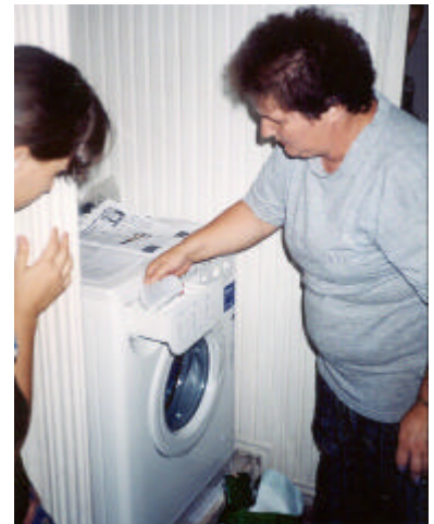
De eerste afgeleverde wasmachine wordt uitgetprobeerd!

T ijdens de septemberreis kon Stichting Manna de derde wasmachine laten plaatsen bij een gezin met elf kinderen. Het bleek een uitkomst, want het ontbreekt daar aan een warmwatervoorziening. We hopen ook in 2002 nog enkele machines weg te kunnen geven.