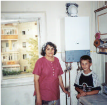
Dankbaar staat de moeder des huizes bij de nieuwe cv ketel.

B ij een ander gezin heeft Manna, dankzij u, financieel kunnen helpen bij de aanschaf en plaatsing van een cv installatie. De vaste lasten van dit gezin zijn, nu zij niet meer afhankelijk zijn van de dure stadsverwarming, flink gezakt.