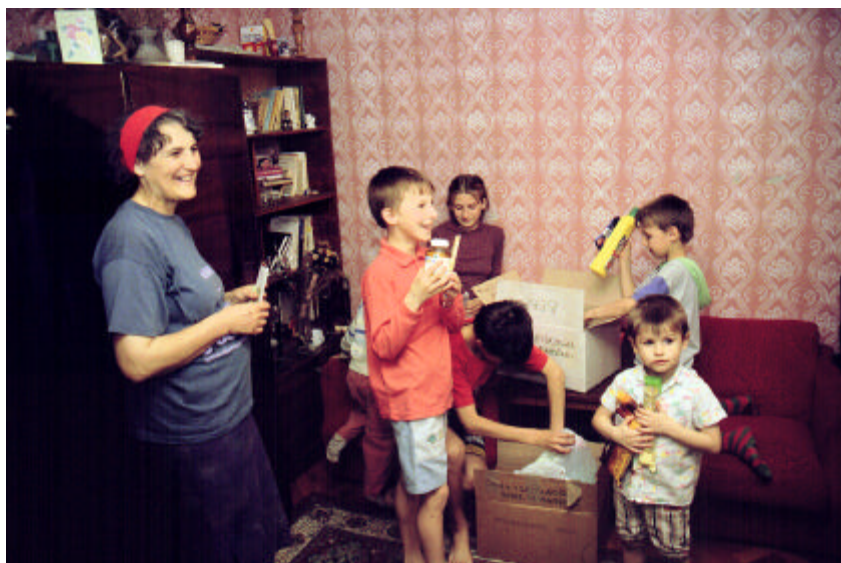
Een feestje: de dozen uit Nederland worden uitgepakt

W at doen we met een lening voor een huis die eigenlijk niet afbetaald kan worden (DM 30.000)? Moeten wij de specifieke medicijnen die een jaar nodig zijn en die niet worden vergoed maar betalen (40,00 per maand)? Wat kun je betekenen voor een straatarm gezin waarvan de man na jaren spoelen van de nieren terminaal is verklaard? En wat te doen met een jong stel uit één van de gezinnen dat zou willen trouwen en heeft berekend dat dat financieel gezien absoluut onmogelijk is? Ook voorlopig maar bij ouders inwonen is onmogelijk. Met twee jaar hulp (160,00 per maand) kunnen ze vooruit.