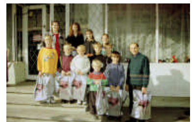
De familie Olinice voor de schoenwinkel met allemaal een tasje!