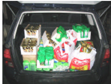
Er wordt altijd voor de pakketten een auto vol spullen bij de supermarkt ingekocht