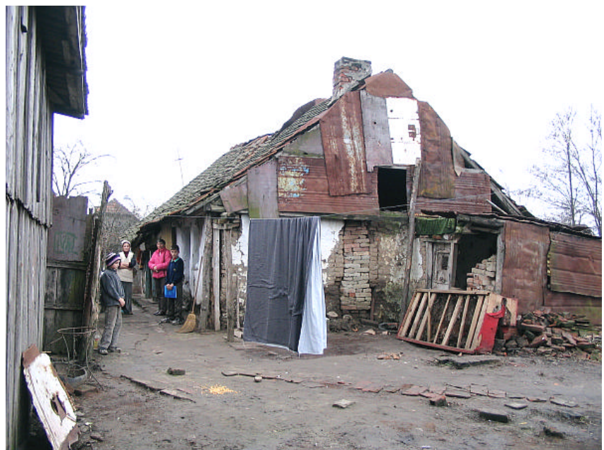
We kregen uit Roemenië een foto van 'het huis' van het nieuwe gezin. Zo te zien hebben we daar nog wat te doen...

Deze reis zullen Joop en Ria ook een nieuw gezin bezoeken, dat volgens de gegevens die we kregen, in onvoorstelbare armoede leeft. Geen elektriciteit en geen gas. Ze wonen in een dorpje vlak bij ons werkgebied: Timisoara. Dit gezin werd ons voorgedragen door een gezin dat al gesponsord wordt via Manna. Zij bekommerden zich al eerder om dit gezin, maar waren absoluut niet in staat structureel hulp te verlenen. Deze reis zal er gekeken worden wat en hoe dit gezin te helpen is. Het is niet voor het eerst dat een gezin dat via Manna geholpen wordt, een ander gezin voordraagt. Het sociale klimaat in Roemenië lijkt